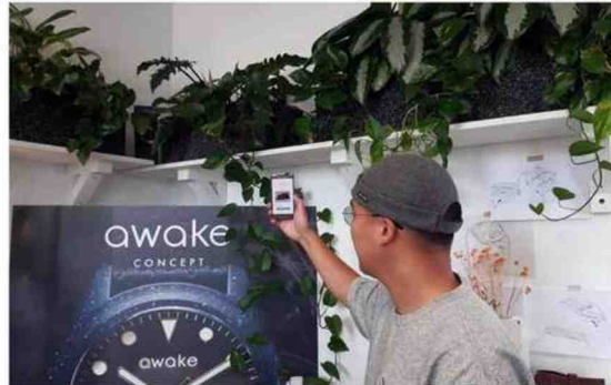
À Paris (Xe), le collectif de créateurs de montres Awake a garni son bureau de plantes vertes, entretenues grâce à l'appli Akagareen.